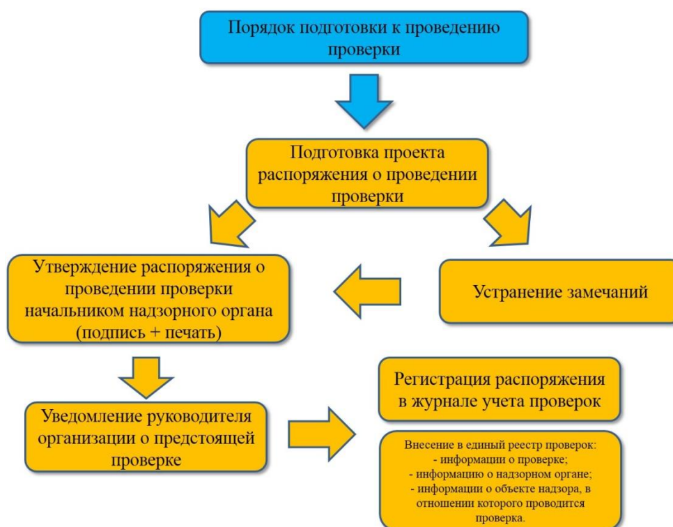
Рис. 6. Порядок подготовки к проведению выездной проверки

Изученный теоретический материал целесообразно представить в виде схемы, данная схема приведена на рис. 6.