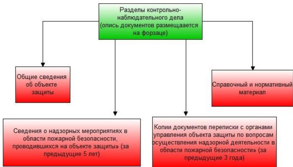
Рис. 1. Разделы контрольно-наблюдательного дела объекта защиты

Информацию, касающуюся наименования разделов контрольно-наблюдательного дела объекта надзора целесообразно представить в виде схемы, изображенной на рисунке 1.