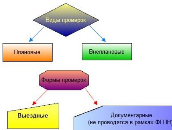
Рис. 3. Виды и формы проверок

гражданской обороне). Подробная характеристика и правила проведения проверок в зависимости от видов и форм были рассмотрены на предшествующей данному занятию лекции и будут отработаны на соответствующих практических занятиях.