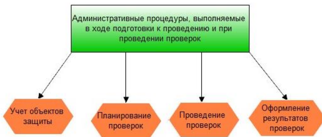
Рис. 2. Основные административные процедуры, выполняемые в ходе проведения проверок и подготовке к их проведению

Для успешного выполнения задания, предусмотренного занятием по рассматриваемой теме необходимо повторить некоторые аспекты выполнения одной из административных процедур, выполняемых при осуществлении федерального государственного надзора за выполнением требований пожарной безопасности - «Ведение учета органов власти, объектов защиты и (или) территорий (земельных участков), а также планирование проверок в органах ГПН», в части касающейся планирования проверок. Целью занятия, на котором необходимы положения, рассматриваемые в данной главе, является выработка навыка по составлению планов проведения проверок. На рисунке 2 приведены основные административные процедуры, выполняемые в ходе проведения проверок.