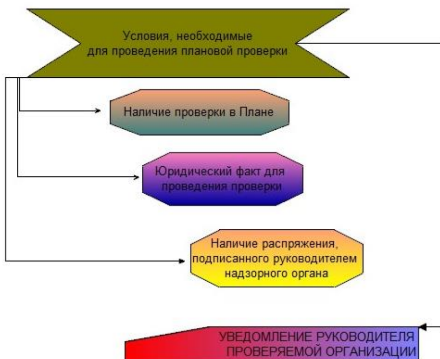
Рис. 4. Условия, необходимые для проведения плановой проверки

На рисунке 4 приведены условия, соблюдение которых необходимо для проведения плановой проверки.