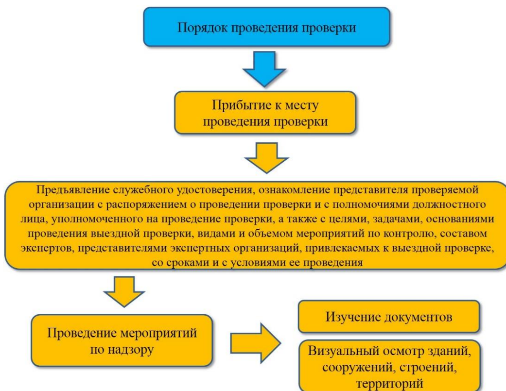
Рис. 7. Порядок проведения проверки

Представим изученный материал в виде схемы (рис. 7).