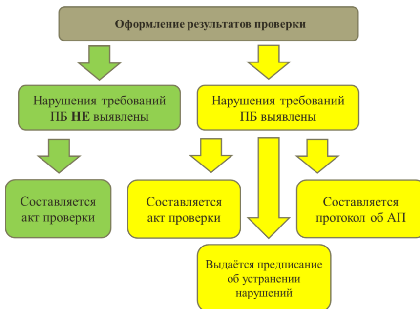
Рис. 9. Завершение мероприятий по надзору

Обратите внимание, что акт проверки составляется при любом исходе проверки, независимо от вида проверки и ее результатов.