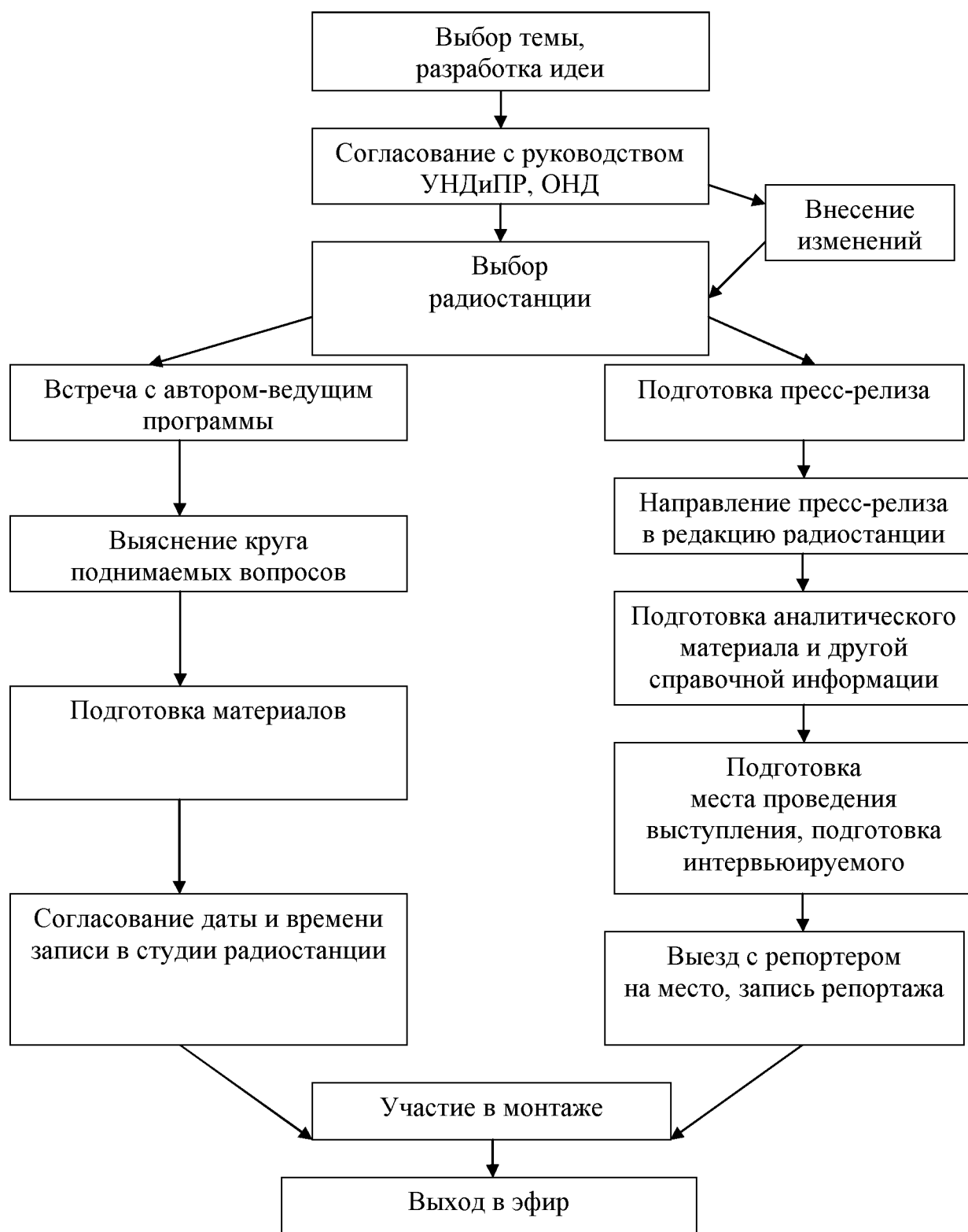
Рис. 1. Схема подготовки радиопередачи на противопожарную тему

Схема подготовки радиопередачи приведена на рис. 1.